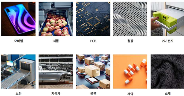
[그림 7] 딥러닝 기반의 머신비전 솔루션 응용 분야

이러한 노력의 결과는 올해부터 그 윤곽이 드러나 내년부터 본격 매출이 기대된다.