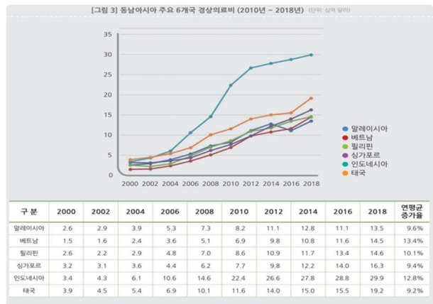
[그림 4] 동남아시아 주요 6개국 경상의료비 추이 (2010~2018년)