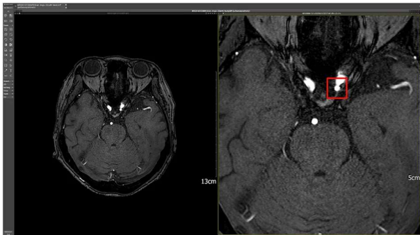
[그림 1] 동사 대표 AI 솔루션 : DEEP NEURO 판독 이미지

보안 AI 솔루션은 공항 X-RAY 검색대에 공급하는 아이템이다. 이 솔루션은 공항 검색용 X-ray 이미지를 분석하여 위험 물질을 효율적으로 탐지하는 시스템으로, 높은 정확도와 신뢰성을 자랑한다. 최근 동사는 글로벌 엔지니어링 업체를 통해 동남아 공항에 진출을 준비 중이며, 향후 수주를 받게 된다면 아시아 다른 국가로 확장이 기대된다. 또한 동사는 동사만의 파운데이션모델 (sLLM/sLMM)을 기반으로 위험물품 뿐 아니라 불법적으로 유입되는 물품을 찾아내는 솔루션을 개발 중이며, 이는 공항 외에도 항만과 같은 다양한 보안 분야에 쓰일 예정이다. 동사는 그동안의 지속적인 연구 개발 결과를 바탕으로 글로벌 업체들과 파트너십을 통해 보안 시장에서의 본격 진입을 앞두고 있어 향후 매출 증대와 시장 점유율 확대가 예상된다.