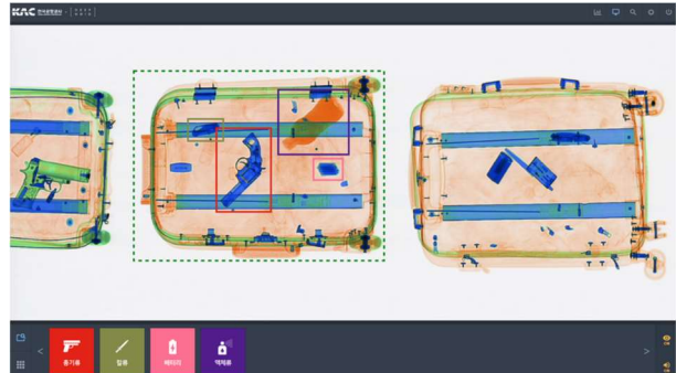
[그림 2] 동사 AI 보안솔루션 : DEEP SECURITY