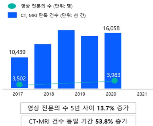
[그림 3] CT,MRI 건수 대비 부족한 영상 전문의 수

여기에 동사는 AI 판독 솔루션을 기반으로 동남아 시장에도 진출할 계획이다. 동남아는 상류층의 의료비 지출 비중이 높고, 수가가 국내 대비 3~5배 이상 높아 잠재력이 큰 시장이다. 동사는 인도네시아, 필리핀, 말레이시아, 베트남 등 동남아시아 국가들 중에서도 의료수요가 큰 국가들과 MOU를 맺는 등 협력을 진행 중에 있으며, 본격적인 수혜는 내년 부터 나타날 것으로 예상된다.